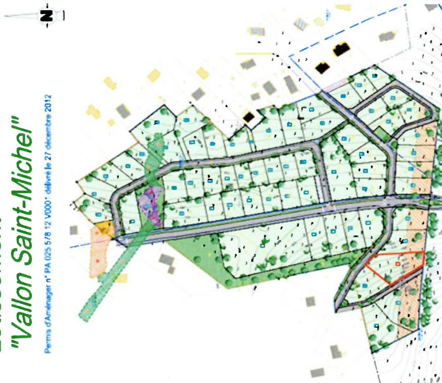
PLAN DE COMPOSITION Échelle 1/2500

Permis d'Aménager n° PA 025 578 12 V03001 délivré le 27 décembre 2012