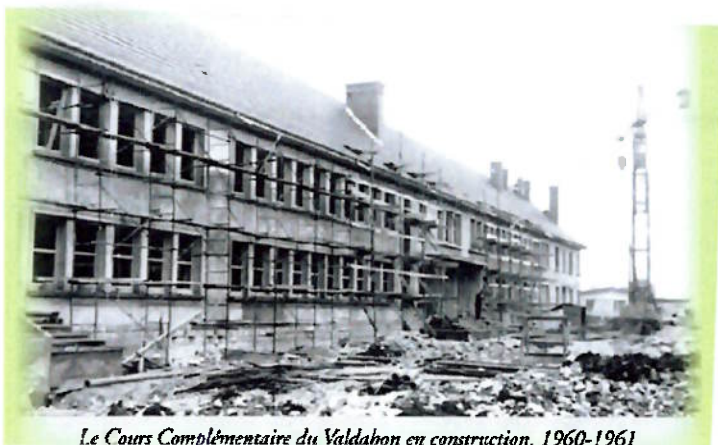
Le Cours Complémentaire du Valdahon en construction, 1960-1961

La médiathèque Brachotte signe ici un bel exemple de médiation culturelle et numérique, mêlant mémoire, créativité et participation citoyenne tout en valorisant l'histoire de bâtiments emblématiques de la Ville.