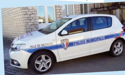
• Dacia Sandero – 2020 – 13000 km Réservé à la police municipale.