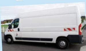
• Jumper – 2017 – 17181 km Transport de gros volumes - Utilisation pour les Restos du Cœur.