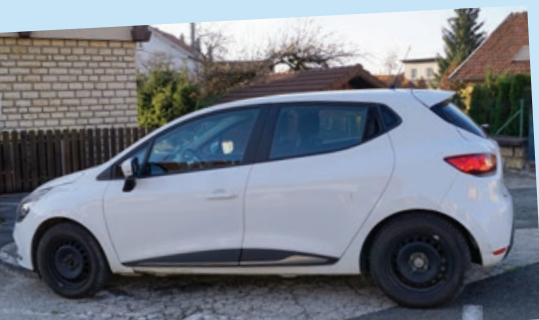
• Clio – 2016 – 30337 km Déplacements du maire, des maire-adjoints et des agents (formation)