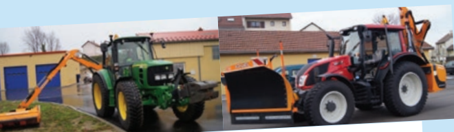
• Tracteur John Deere* – 2013 – 1492 heures - • Tracteur Valtra – 2016 – 894 heures Déneigement – transport de palettes – transport de matériel lourd Fleurissement - plantations. * possède un chargeur (terre, copeaux, sable...)