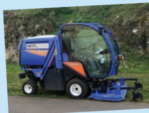
• Iseki – 2016 – 657 heures Tonte et mulching des grandes surfaces (terrains de sport) - Ramassage des feuilles.