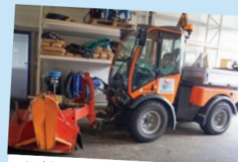
• Holder - 2011 – 1790 heures Déneigement/broyage d'herbe – transport de petits outils et matériel de voirie. Désherbage avec brosse - Broyage parcelle - Balayage.