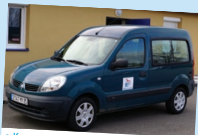
• Kangoo – 2006 – 41719 km Déplacements du responsable des ateliers municipaux et formation des agents techniques