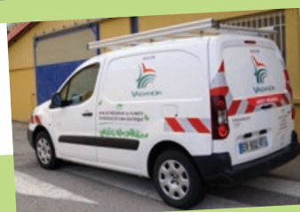
• Partner – 2017 – 6436 km Attribué à l'électricien.