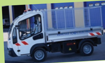
• Goupil – 2014 – 1816 heures Nettoyage voirie, ramassage des poubelles, désherbage.