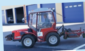
• Carraro – 2014 – 947 heures Déneigement des trottoirs – Tonte.