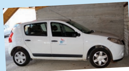
• Dacia Sandero – 2009 – 46539 km Déplacements des agents de la direction des services techniques et de l'ensemble des agents communaux (formation...)