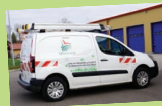
• Berlingot – 2016 – 13364 km Service de dépannage.